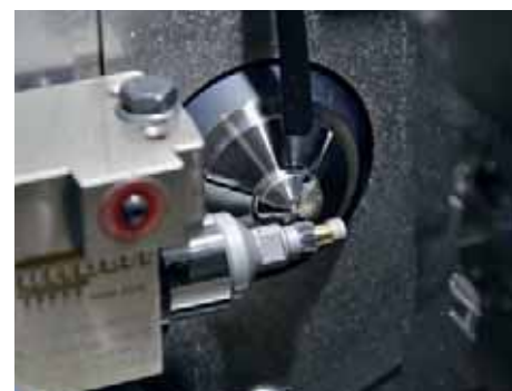
Oxomedic kann alle möglichen Werkstücke mit Verzahnung auf der Maschine fertig bearbeiten. Der Verzahnungsapparat ist sehr einfach handzuhaben.