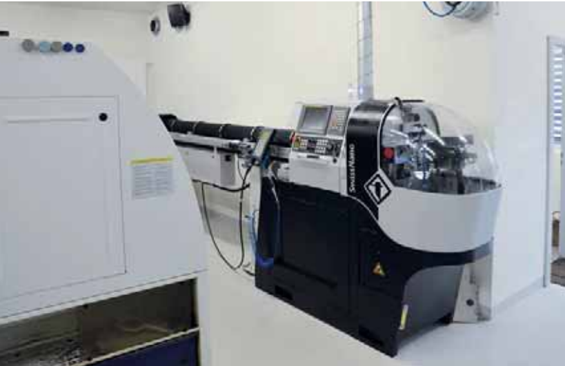
Der geringe Platzbedarf der Maschine SwissNano ermöglicht deren Installation in relativ beschränkten Räumlichkeiten.