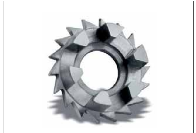
Mit der Maschine SwissNano kann Oxomedic seine Werkstücke fertig bearbeiten, inklusive Verzahnungen wie sie für Uhrentriebe benötigt werden.