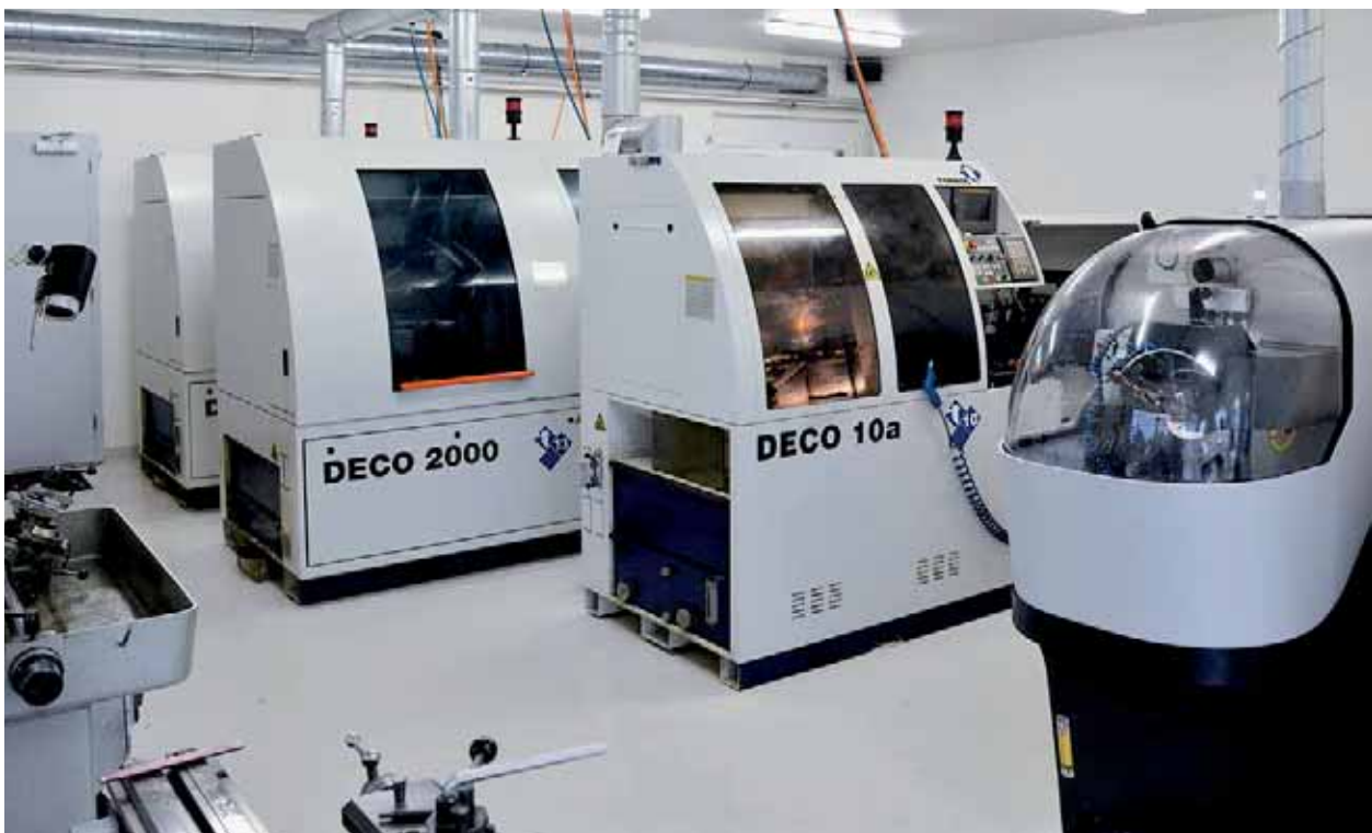
Oxomedic hat kürzlich seine Räumlichkeiten vergrössert. Eine weitere Fläche in der Grösse seiner gegenwärtigen Produktionswerkstatt kommt bald hinzu.