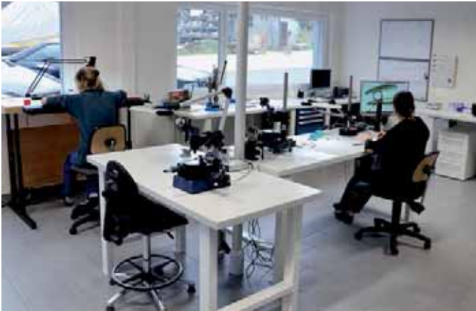
Das Unternehmen ist entsprechend ausgerüstet, um Mass- und Sichtkontrollen durchzuführen. Je nach Bedarf werden 100% der Produktion geprüft.