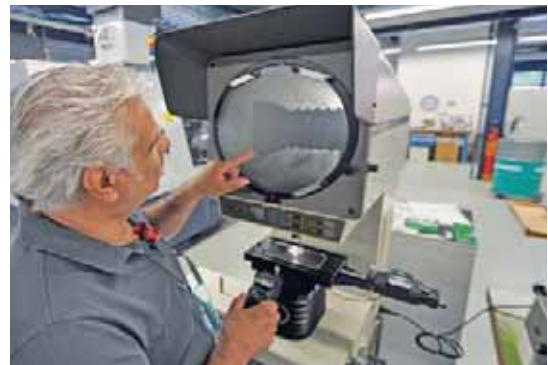
Die Qualitätskontrolle ist ein zeitintensiver, aber besonders wichtiger Schritt auf dem Weg zu einem perfekten Endresultat. Bei TS Décolletage in Bedano werden eigens auf die Bedürfnisse der verschiedenen Kunden ausgelegte Prüfprozedere angewendet.