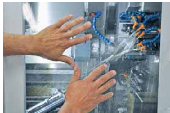
Durch den Verzicht auf problematische Stoffe in Ortho NF-X und einen geringen Vernebelungsfaktor wird eine sehr hohe Arbeitsplatzqualität erreicht.