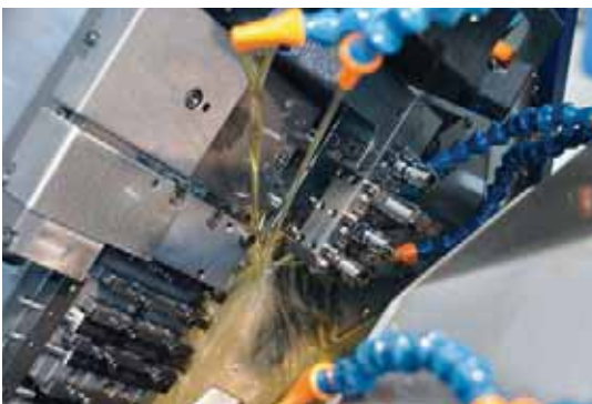
Motorex Ortho NF-X eignet sich bestens für alle bei der TS Décolletage SA eingesetzten Bearbeitungszentren. Die Zusammenarbeit zwischen Tornos und Motorex generiert einen zusätzlichen und wertvollen Nutzen für den Anwender.