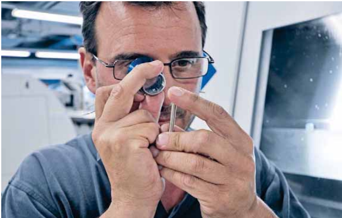
Die TS Décolletage SA ist ISO 9001-2000 zertifiziert und seit deren Gründung unternehmergeführt. Dabei setzt der modern ausgerüstete Betrieb alles daran, die hohen Erwartungen der Kundschaft immer ein wenig zu übertreffen.