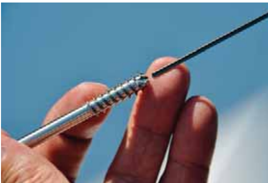
Durch Tests bei einer Tieflochbohrung von 200 mm sind die Verantwortlichen bei der TS Décolletage SA auf die vorteilhaften Eigenschaften von Motorex Ortho NF-X aufmerksam geworden. Heute arbeitet der ganze Produktionsbetrieb damit!

Mit dem Bezug der neuen vollklimatisierten Räumlichkeiten im Jahre 2007 und der Investition in eine neue Maschinengeneration setzt das Unternehmen konsequent auf High-Tech. So werden immer häufiger äusserst anspruchsvolle und komplexe Anwendungen von A bis Z in Bedano ausgeführt. Mit den Superfinish-Schleiftechniken, aufwändigen Innenbearbeitungen unterschiedlichster Materialien (Titan, Inox, CrNi, Bunt- und Edelmetalle) hat auch das eingesetzte Bearbeitungsfluid einen eklatanten Einfluss auf den Produktionserfolg. Ausschlaggebend für die Umstellung des ganzen Betriebs auf das universelle Hochleistungs-Schneidöl Ortho NF-X von Motorex war eine 200 mm Tieflochbohrung in einem Medizinteilteil mit einer hohen Grundhärte aus Inox 1.4472. Mit dem vorgängig eingesetzten Schneidöl konnten keine befriedigenden Resultate punkto Masshaltigkeit und Stückzeiten erreicht werden. Weil Tornos seine Maschinen mit Bearbeitungs- und Betriebsfluids von Motorex entwickelt und in Betrieb nimmt, kennt der Maschi-